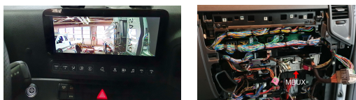
MBUX mit Navigation 31 Pin Stecker

Interface für Rückfahrkamera Nachrüstung für MB Actros 5 mit MBUX + Multimedia Cockpit Code J6B/J6C 10,25Zoll und Navigation J2V. Unabhängig ob Kameravorrüstung- Code: J9P/J9J oder keine Kameravorrüstung – wichtig das ein MBUX verbaut ist, dann ist das Kamerabild im Vollbildmodus.