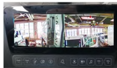
Kamerabild geteilt-wenn manuell angewählt, während kein R eingelegt ist.