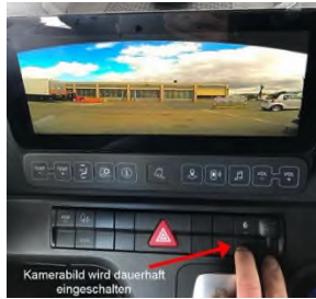
mit oder ohne Navi