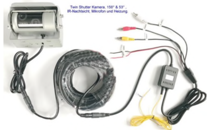
Twin Shutter Kamera, 150° & 53° IR-Nachtsicht, Mikrophon und Heizung.