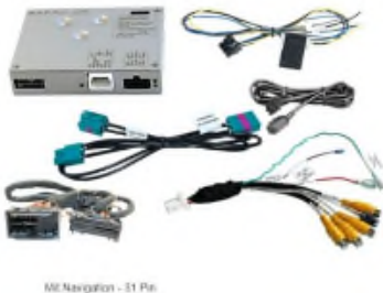
MC-Navigation - 51 Pin

Sensor-Typ 1/4 Sony CCD HAD II, NTSC, Mikrophon, 4 Infrarot-LED für Nachtsicht, Auflösung Pixel 470.000 Kamera 1: 0 Lux (mit eingeschalteten IR-LED) Kamera 2: 1 Lux Kamera 1: H120°+V90°+D150° Kamera 2: 43°+32°+53° Aufnahme max. 3W, IP69K Arbeitstemperaturbereich -40°C bis +85°C Abmessungen BxHxT 114x57x59mm, Gewicht 634g