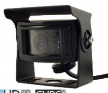
AHD NTSC, 130° 9 LEDs, IP69