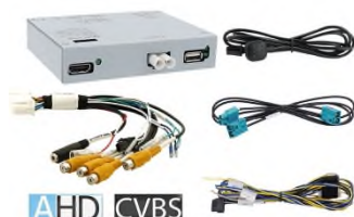
Video Interface AHD