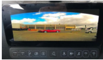
mit oder ohne Navi