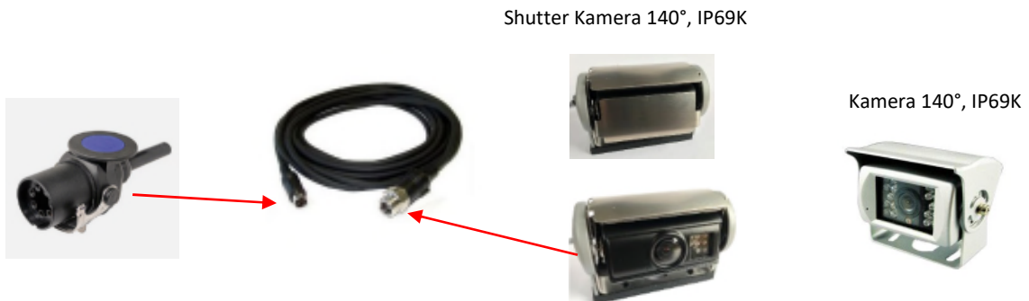
Kabel 20m zum Stecker/Verriegelungsbügel für 2.RFKamera