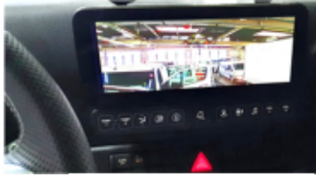
mit oder ohne Navi